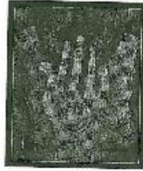
لوحة (٦) للفنان سعيد القلقون - (صمت الصبي)

البريتك وخضات مختلفة على كرتون وخشب - ٢٤ × ٢٠ سم - ٢٠٠٤ م.