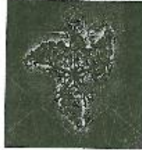
لوحة (٨) للفنان عمرو الأطروشي - نظام بناني فرقتالي مستوحى من طائفة الجند شوكيات البحرية (تجم البحر) طباخة كمبيوتر على ورق فوتو مط - ٣٥ × ٤٠ سم - ٢٠١٠ م.