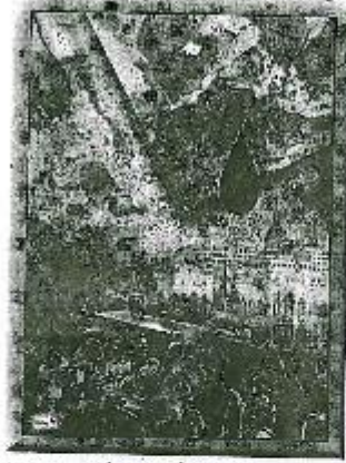
لوحة (١) للفنان أحمد البيهاتي - أحداث برسوم - ٣٥ × ٢٥ ألوان زيتية على ورق واستخدام الفولكلور سوريا ٢٠١٣م. ١١