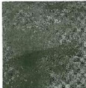
لوحة (٤) لفنان حازه لحدوت ١٠٠×١٠٠مقال شاطن ميتله تاج ١٩٩٦م