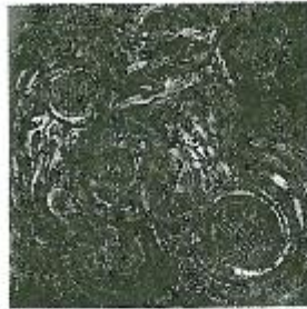
لوحة (٣) لفنان أندرف فالتواي، تكوين مستوحى من بسطة كوفي تركيية وإنتقالية - كوان أكريشك وكسيونار جرنهله وكولاج على ورق ٣٥×٤٦سم - ٢٠١٢م ١١