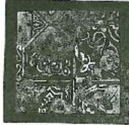
لوحة (٧) للفنان لعمامة القمصين من سورتن جوارات لرائحة - ٢٤ × ٢٢ م.

البريتك وخضات مختلفة على كرتون وخشب - ٢٤ × ٢٠ سم - ٢٠٠٤ م.