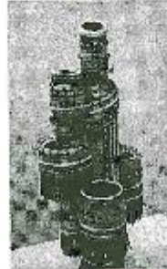
تشكيل مجسم (١١) للتلان محمود عشتق جمال قبي خزلي واسطوانات من قماركول وحدات ابداعية - ٢٠١١م. ١٦

سئلة اوضح اول الذي تراكمة الصورة على استنق (١) ساعر لامل القبي قبي تعضله مع تفر سبب ؟